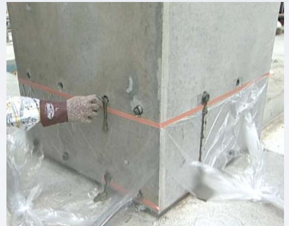
續接器與構材接合部之同時填充