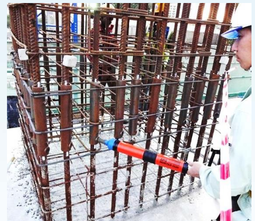
注入TTK水泥砂漿(手動式)