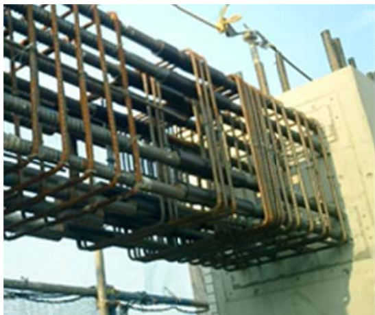
標中央固定鋼筋之接合