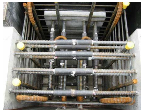
接頭區內固定鋼筋之接合