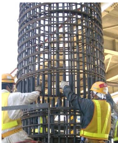
基樁固定鋼筋之接合